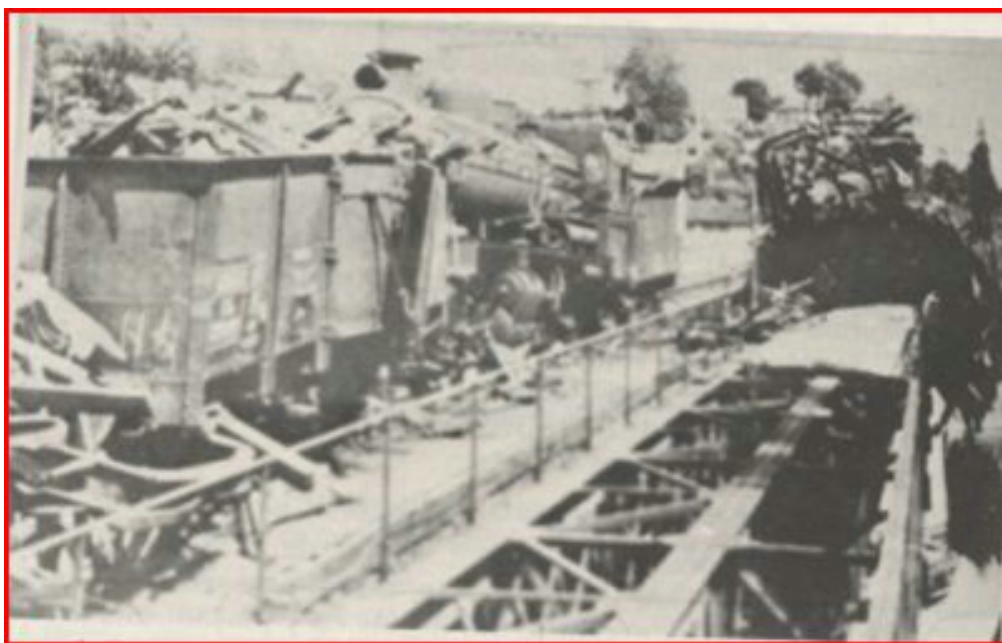
Le pont ferroviaire à Saint-Junien, saboté le 8 juin 44

« Dans la nuit du 7 au 8 juin, le maquis avait tenté de faire sauter le viaduc qui franchit la Vienne à 1 kilomètre à l'ouest de Saint-Junien sans résultat appréciable. Le matin du 8 juin vers 9 heures, afin d'interrompre tout trafic sur la ligne Angoulême-Limoges, et après un déboulonnage des rails (toujours sur le même viaduc), une locomotive et quelques wagons furent lancés sur la voie. Les wagons tombaient dans la rivière, la locomotive et son tender déraillaient mais restaient sur le pont. Le trafic était interrompu... ce même jour, le maquis venait prendre possession de la Mairie et de la légion. »